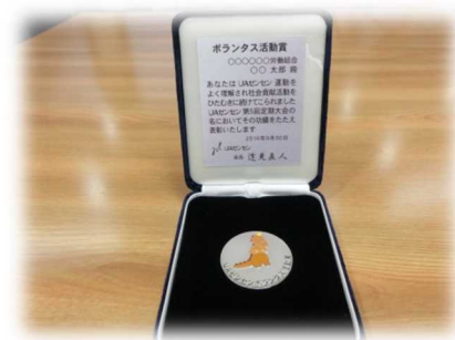
記念のメダルを贈呈します